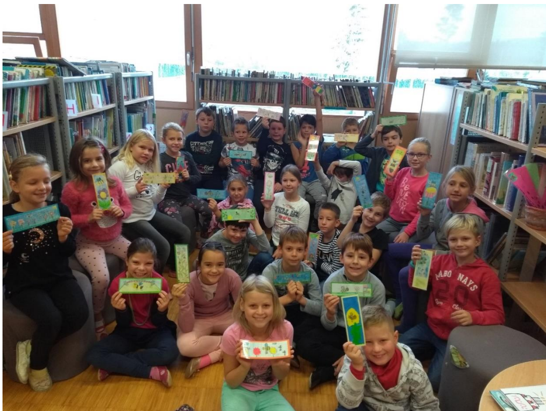
3.b še zadnjič s svojimi kazalkami – z veseljem so jih poslali učencem 3.b na OŠ Fram