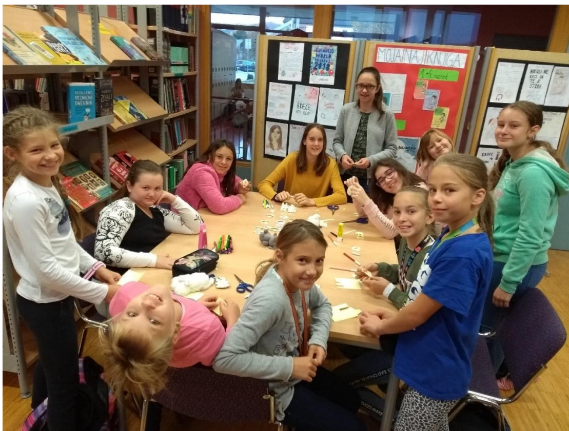
Ustvarjalno druženje pred poukom v naši šolski knjižnici