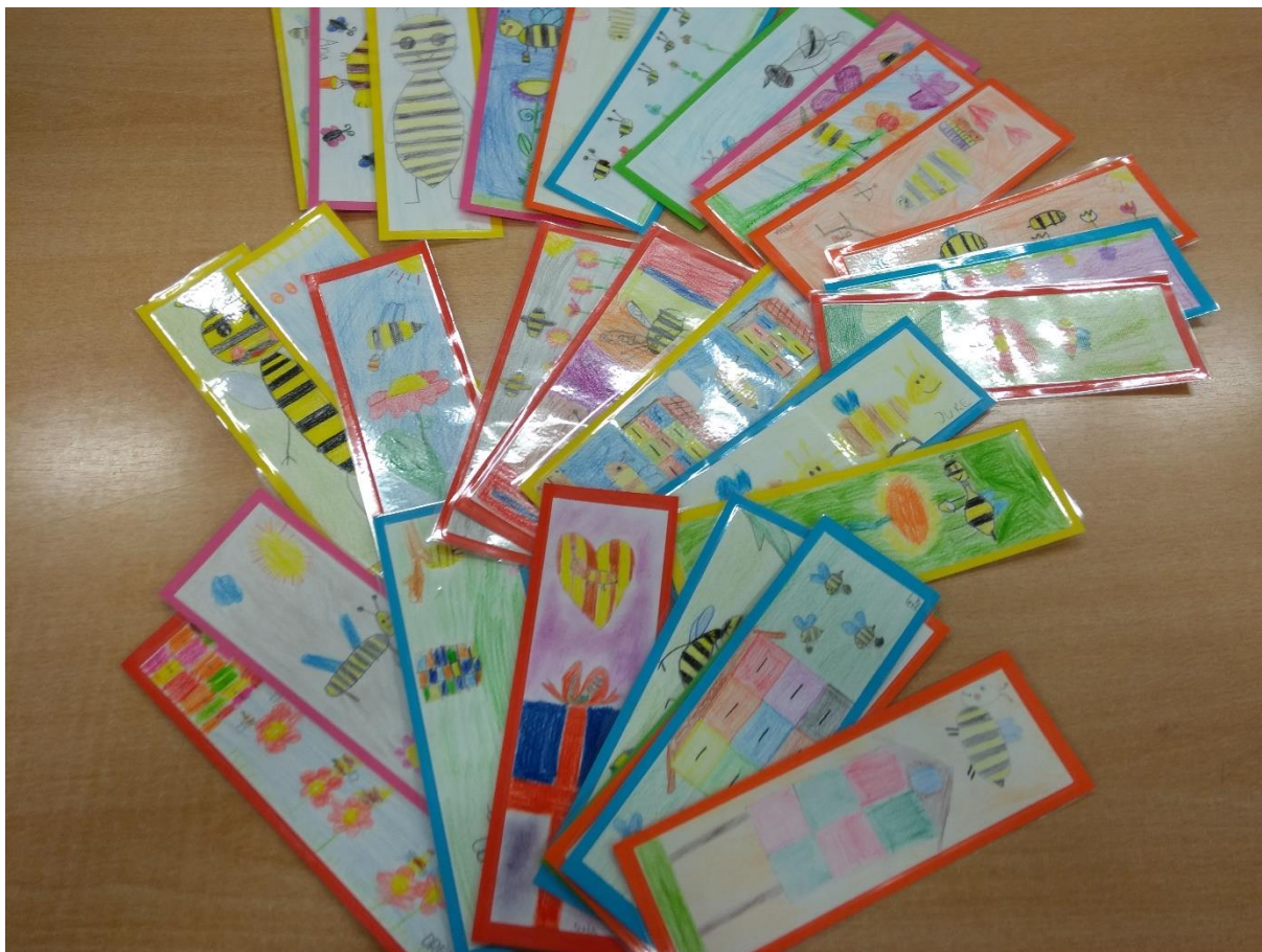
Knjižne kazalke, ki smo jih poslali na OŠ Fram

Povezali smo se z mladimi bralci čisto na drugem koncu Slovenije. S šolsko knjižnico OŠ Fram smo se dogovorili, da razveselimo drug drugega s knjižnimi kazalkami. Tako so za naše štajerske prijatelje ustvarjali učenci 3. razredov, knjižničarski krožek in učenke višjih razredov, ki rade prihajajo pred poukom v knjižnico. Naši tretješolci so ustvarjali ob prazniku zbirke Čebelica, zato so bile njihove kazalke še posebej zanimive. Na vsaki se je namreč skrivala vsaj ena čebelica. Otroci pa so bili zelo veseli, ko smo po pošti dobili kuverto s kazalkami, ki so jih zanje naredili učenci OŠ Fram. Vsak je izbral eno in verjamemo, da bodo zdaj še bolj navdušeno brali.