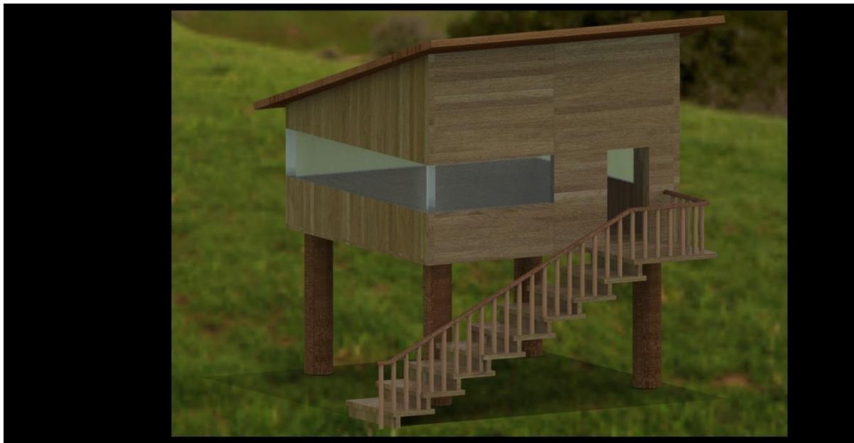
Slika 7: Pogled 2