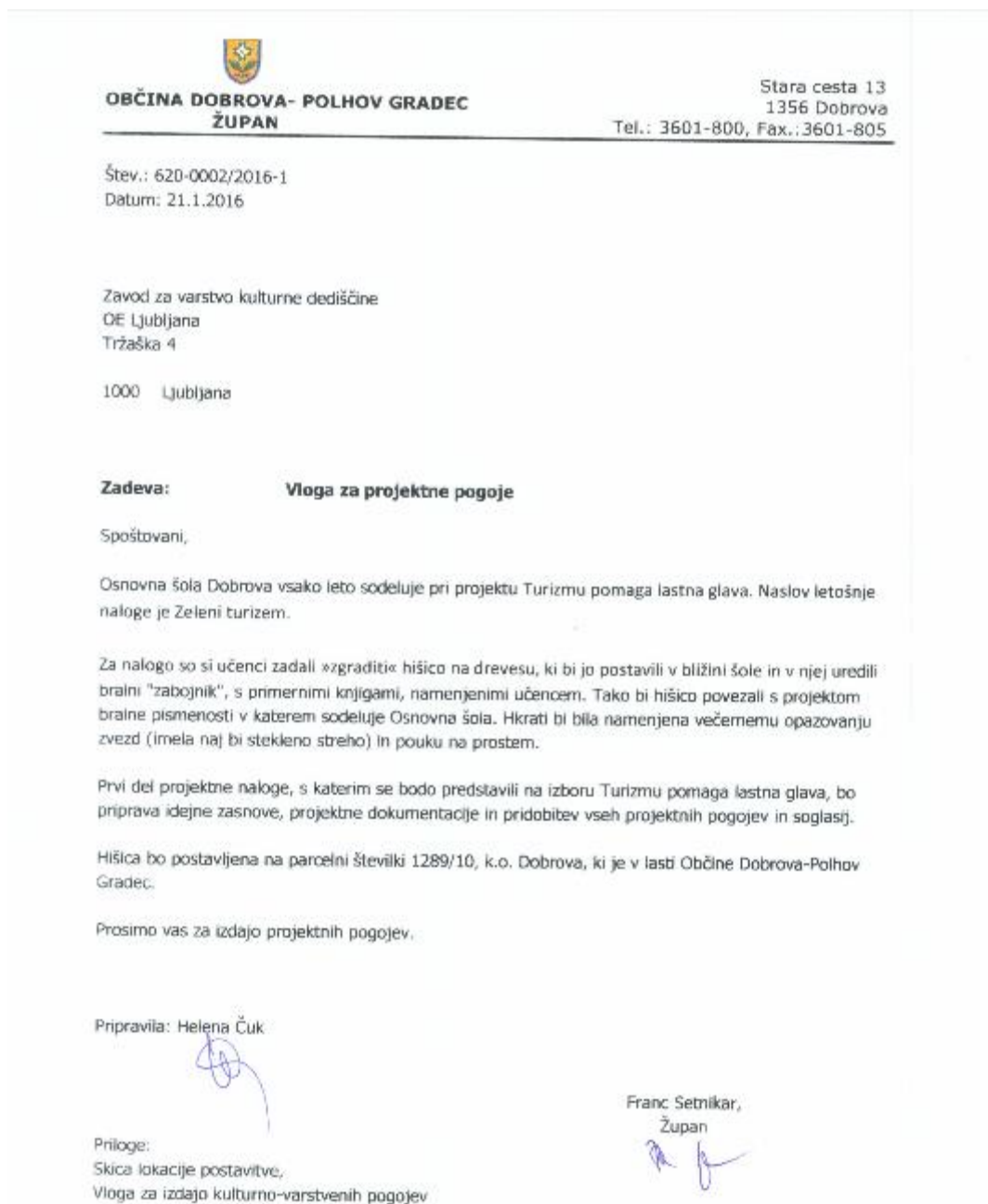
Slika 12: Vloga za projektne pogoje

Z okvirno ceno, s točno lokacijo in z veliko volje smo ponovno zaprosili občino za pomoč. Ker naša šola stoji na arheološko varovanem območju, smo morali zaprositi za dovoljenje Zavod za varstvo kulturne dediščine. Vlogo smo oddali skupaj z občino, saj je lastnik šole in zemljišča Občina Dobrova – Polhov Gradec. Prav tako smo zbrali dokumentacijo za gradbeno dovoljenje.