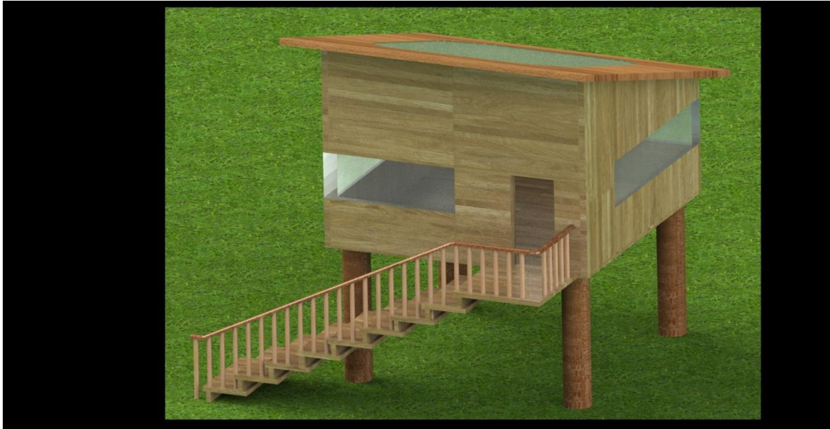
Slika 9: Pogled 4