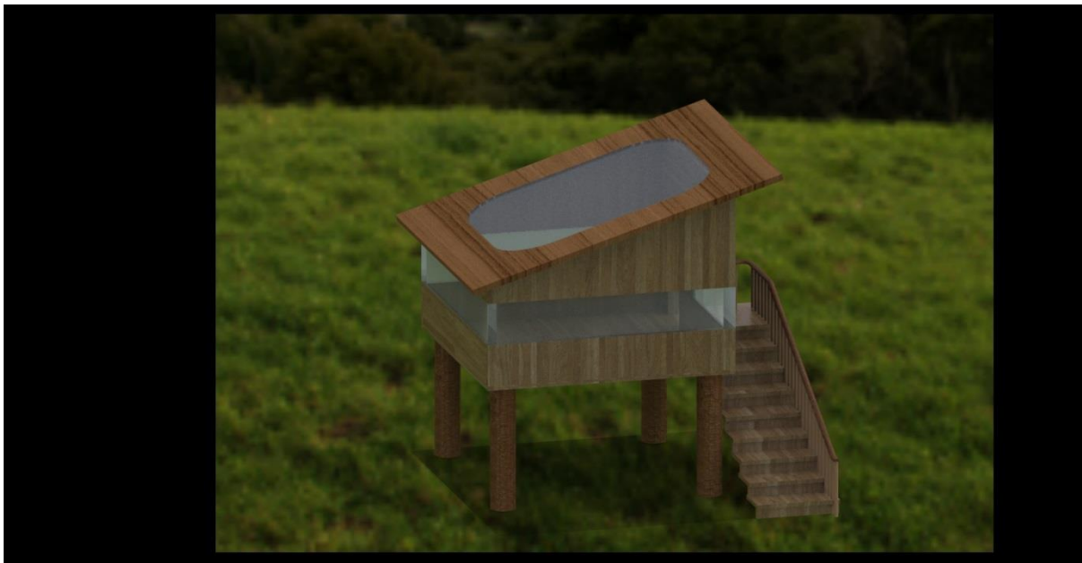
Slika 6: Pogled 1

Okvirna cena, ki so nam jo na podlagi naših želja izdali, je bila 35000 evrov. To je cena za izdelavo celotnega projekta. Prijazno so nam ponudili pomoč pri izpeljavi.