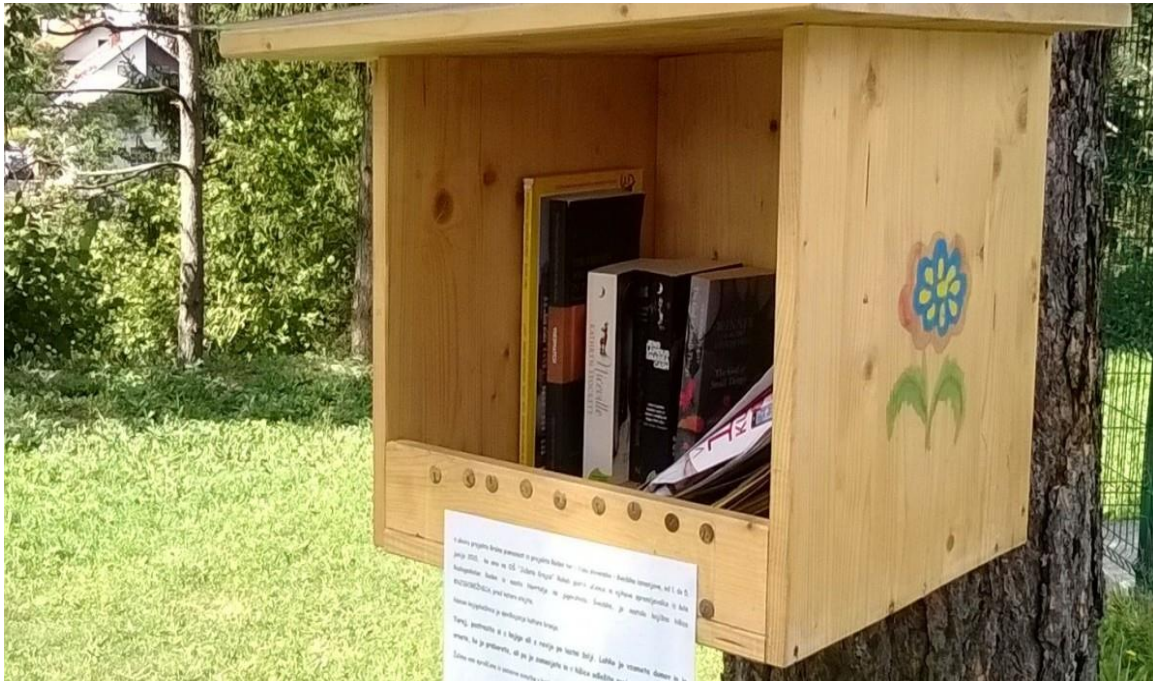
Slika 3: Knjižna polica na prostem