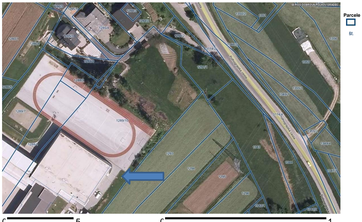
Slika 14: Lokacija hišice