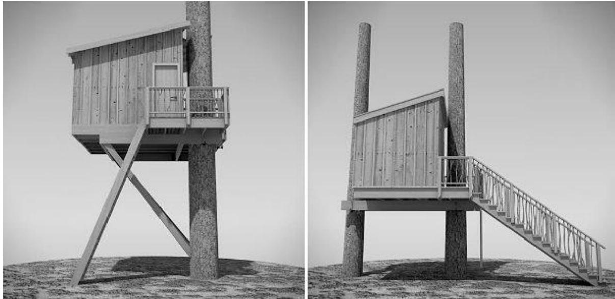
Slika 1: Primer hišice ob drevesu

Veliko idej in zanimivih slik smo našli ravno na spletnih straneh.