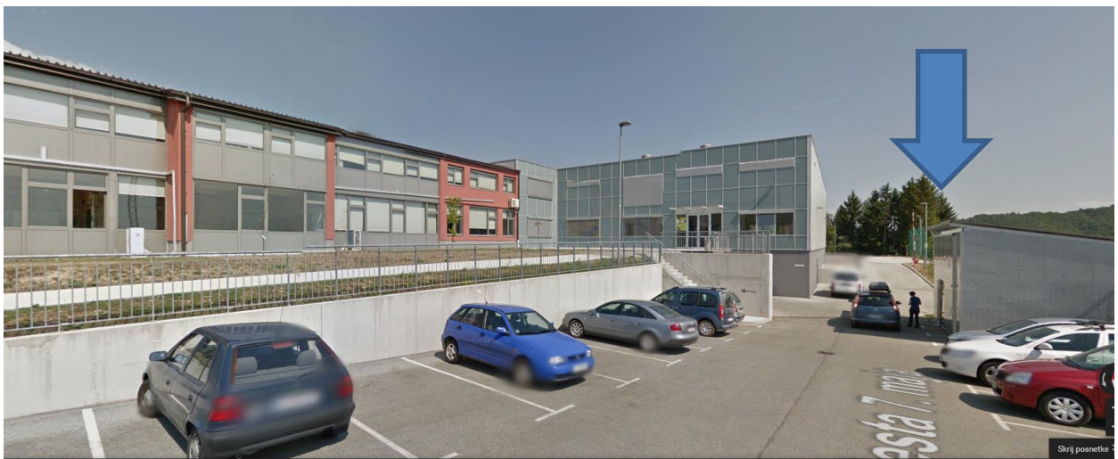
Slika 11: Fotografija šole z dvorano, kjer je označena lokacija Hišice pod zvezdami

Na hitro smo naredili skico, kjer smo označili lokacijo. Ugotovili smo torej, da je najbolj primeren kotiček ob šolskem športnem igrišču (lokacija št. 3), kjer je čudovit razgled in dobra podlaga za postavitv. Tako omogočamo učencem in ostalim pogled na Ljubljano, Dobrovo in Polhov Gradec.