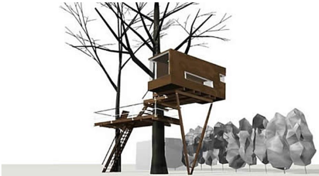
Slika 4: Dvonivojaška hišica