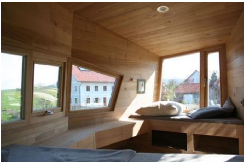
Slika 2: Notranjost hiše