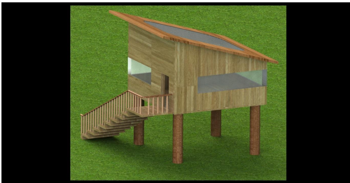
Slika 8: Pogled 3